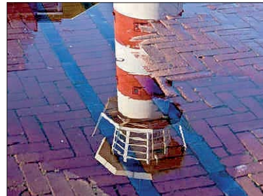
Vuurtoren van Madurodam in regenplassen.

DEN HAAG - Fotografe Dorine Kleinloog debuteert met de expositie 'Haagse Spiegels' bij Galerie HAAGS. Dorine fotografeert zeer Haagse gebouwen en plekken in plassen regenwater. Het resultaat zijn vervreemde foto's van bekende plekken. Direct herkenbaar als je de titel leest. "Maar natuurlijk dit is ....", denk je dan. De opening van de expositie vindt zaterdag 8 mei van 19.00 tot 21.00 uur plaats.